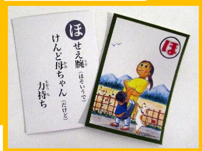
上：所沢郷土かるた