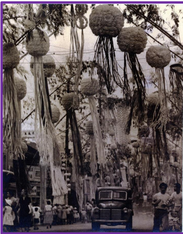
左：昭和30年頃 所沢銀座通り

最終日午後 2 時まで 但し、21(土)の「第10回野老澤行灯廊火」当日、当店はきもだめし会場になるため17(火)~23(月)まで 展示をお休みさせていただきます。