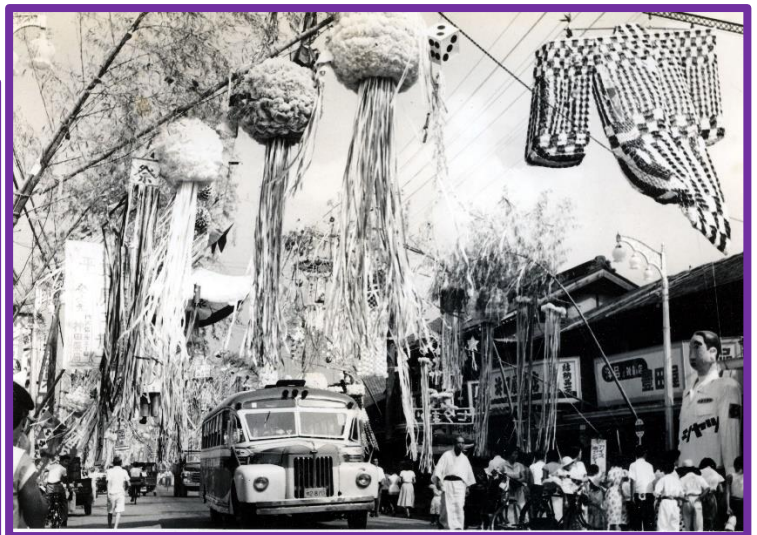
昭和30年頃 神田薬局 所沢銀座通り