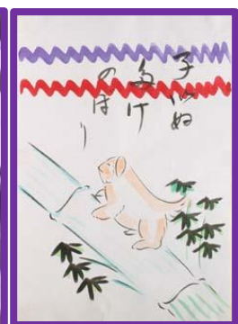
地口絵 鯉の滝登り→子犬竹登り