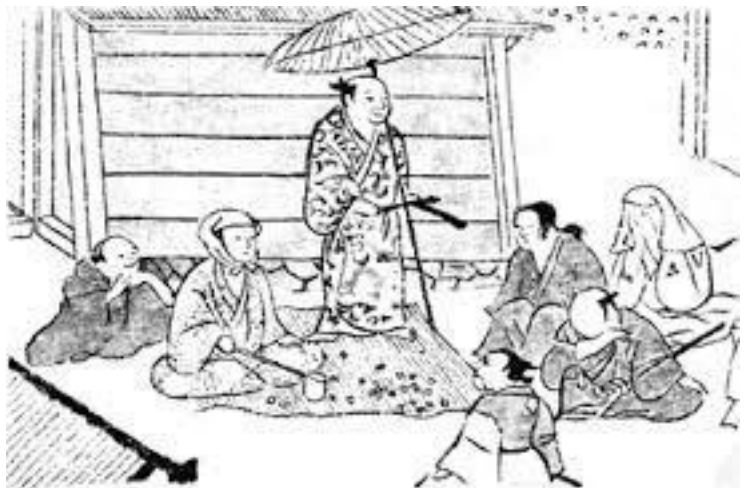
八坂神社所蔵『洛中洛外図』（元和年間）にみえる野外での説経節

限定35名（事前申し込み要）資料代500円 電話または来店の上お申し込みください。