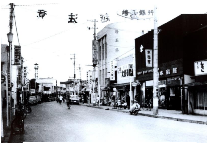
昭和40年頃の大通りのサイギン前 (現：スカイライズタワー付近)