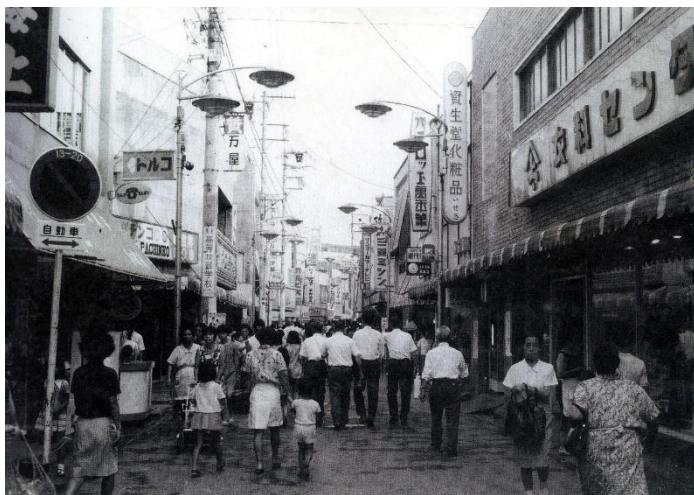
昭和45年頃プロペ商店街 (現：いせき付近)