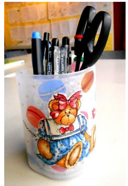
作品例 デザイン違いを2つ作ります。